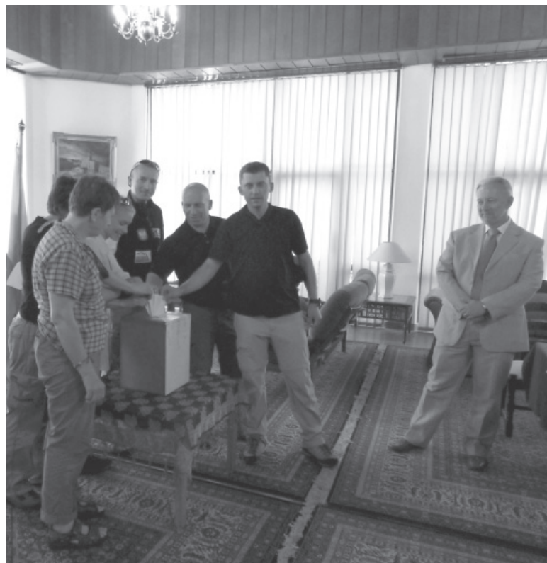
Głosowanie w Ambasadzie RP w Islamabadzie

Pozdrawiamy, K2 & Broad Peak Polish Expedition 2010