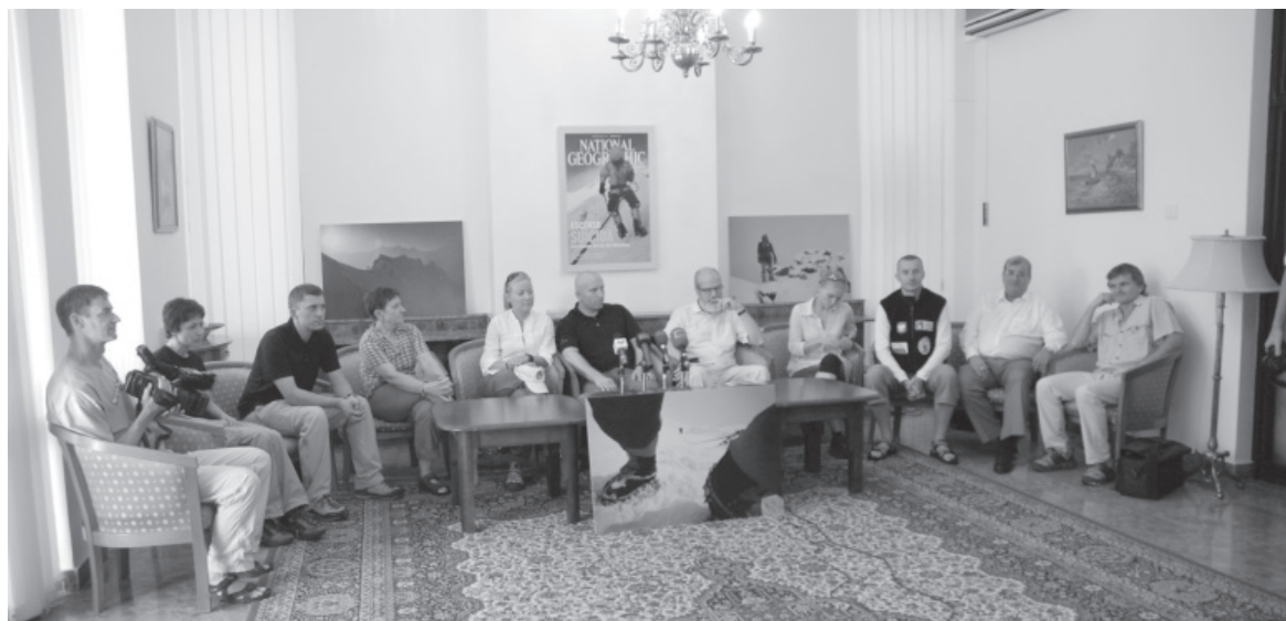
Konferencja prasowa z udziałem pakistańskich mediów w Ambasadzie RP w Islamabadzie